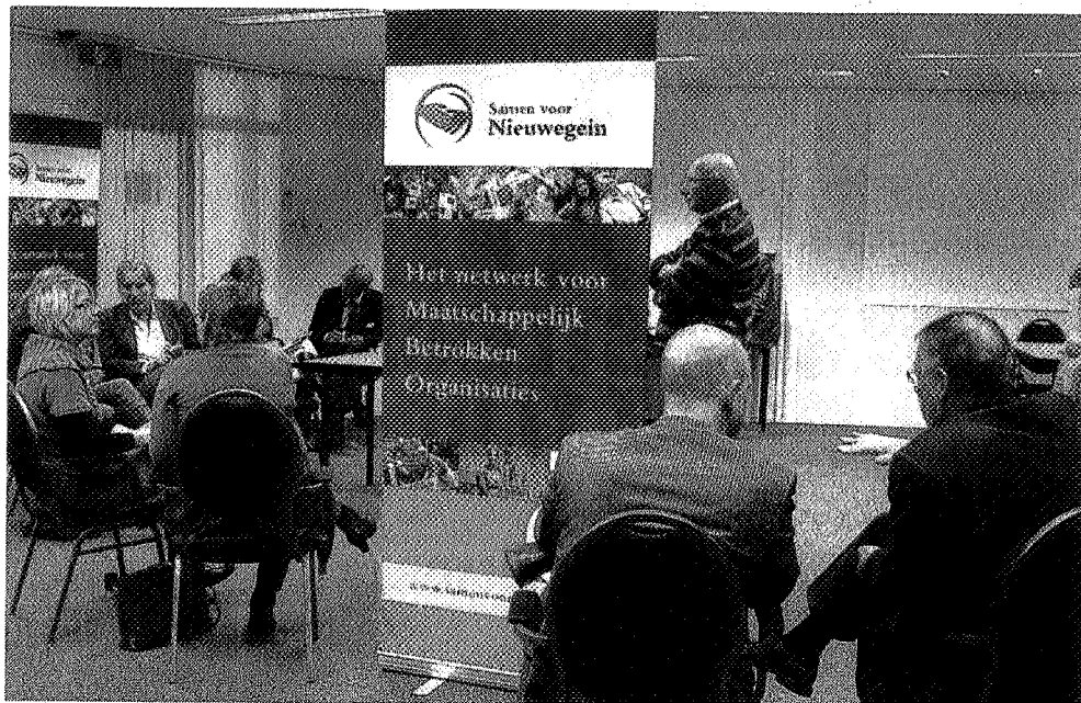
Partnerbijeenkomst bleek succesvol.